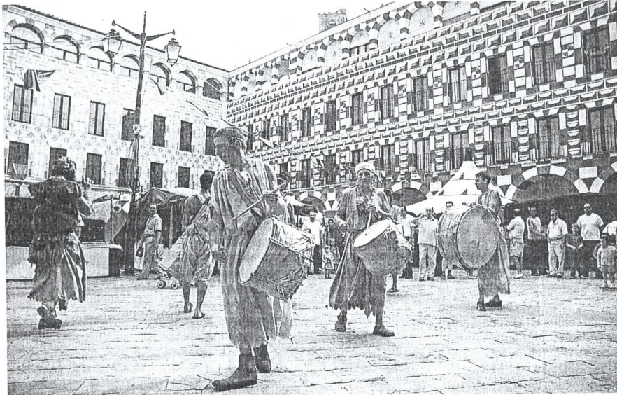
Badajoz es considerada por los extremeños como uno de los municipios más completos.

Los puestos de cabeza cambian ligeramente cuando lo que se tiene en cuenta es cuál es el mejor destino para estudiar, y aunque Madrid, sigue en la palestra, Salamanca se cuela en segundo lugar seguida de Barcelona; mientras