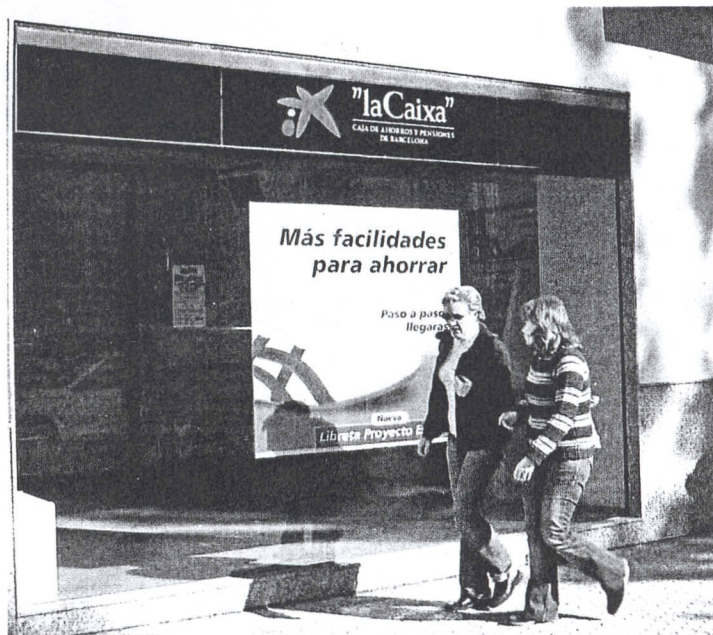
La caja catalana no sólo lidera el ranking general, también los de ética, RSC e identificación