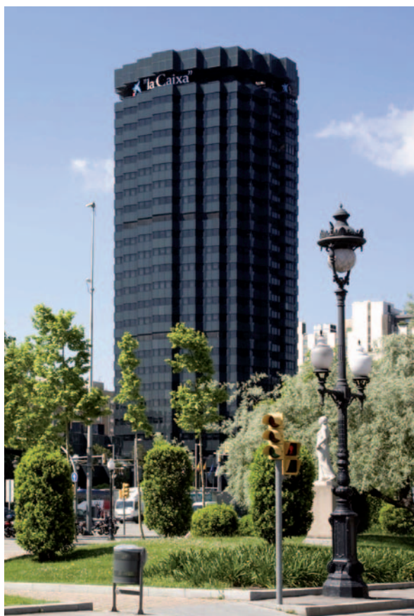
"la Caixa" es la empresa más responsable del nuevo ranking de Merco.

Se encuentra, por tanto, un paralelismo entre las empresas más responsables y las que tiene mayor reputación, pues ocho de las diez empresas que lideran el nuevo ranking de responsabilidad están también en el top ten del ranking de reputación. ■