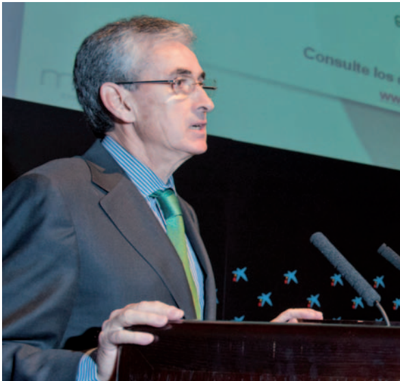
El ministro de Presidencia, Ramón Jáuregui, en la presentación.

En el caso de las mujeres directivas, también una ejecutiva del Santander se encuentra a la cabeza. Ana Patricia Botín (17ª) se mantiene como la primera mujer de las 11 que aparecen en